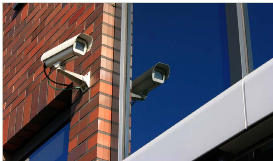
Bild- och ljudmaterial från kameraövervakning av en plats dit allmänheten har tillträde får inte bevaras under längre tid än två månader, om inte länsstyrelsen beslutar om en längre bevarandetid.

När bild- eller ljudmaterial inte längre får bevaras ska det omedelbart förstöras.