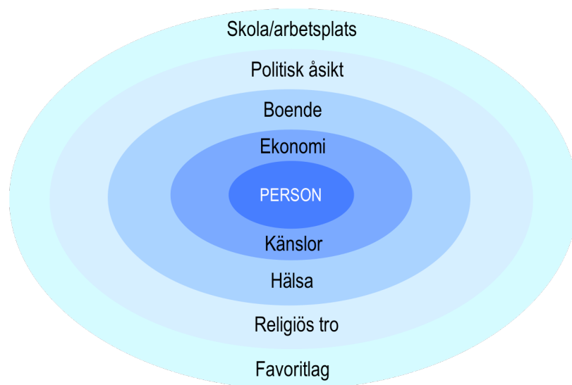
Figur 1 - Den privata sfären för ungdomar

Motståndet är förvånande nog inte särskilt stort när det gäller olika typer av information som traditionellt uppfattas som känslig. Relativt många kan tänka sig lämna ut uppgifter om sina politiska åsikter 52 % ( 54 % ) och sin religiösa uppfattning 66 % ( 66 % ). En tolkning är att för de flesta unga präglas dessa frågor av ett lågt engagemang. I mellanskiktet är åsikterna mer spridda och där hittar vi t ex uppgifter om hälsa, 40 % ( 39 % ). Generellt är könsskillnaderna och ålderskillnaderna små samt att de som bor i större städer är mer öppna med privat information.