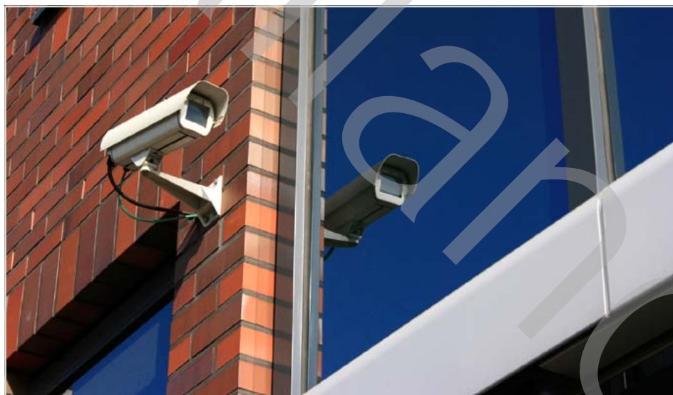
Bild- och ljudmaterial från kameraövervakning av en plats dit allmänheten har tillträde får inte bevaras under längre tid än två månader, om inte länsstyrelsen beslutar om en längre bevarandetid.

När bild- eller ljudmaterial inte längre får bevaras ska det omedelbart förstöras.